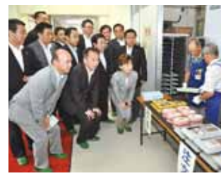
(7月2日 鶴見区・矢向中学校)

公明党市会議員団は従来から「横浜方式のスクールランチ」を提案しており、本年2月の市会本会議では「これまでの調査を踏まえ、早期に具体的な取り組みを行うべき」と主張しました。横浜市教育委員会はこれを受け、6月下旬から3週間にわたり市立中学校における昼食のあり方検討のモデル実施協力校でデリバリー方式の昼食提供を行うこととしました。 公明党市会議員団は協力校の一つを訪ね、再加熱カート方式の昼食提供の模様を視察しました。今回のモデル実施も参考に、「横浜方式のスクールランチ」にふさわしい提供内容や方法を検証していきます。