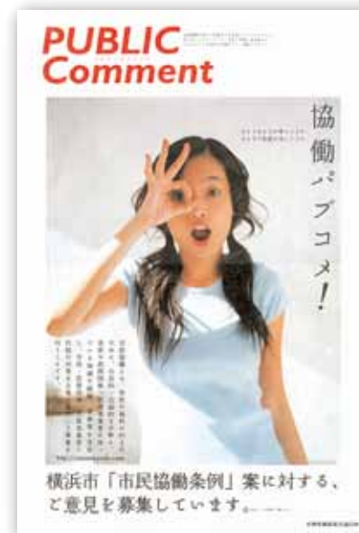
横浜市「市民協働条例」案に対する、ご意見を募集しています。