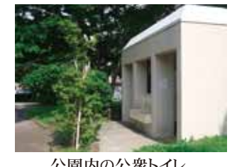
公園内の公衆トイレ

高齢者や障がい者の皆様のご要望に応え、横浜市瀬谷スポーツセンター前にある瀬谷南台公園内設置の和式トイレを洋式に取り換えました。