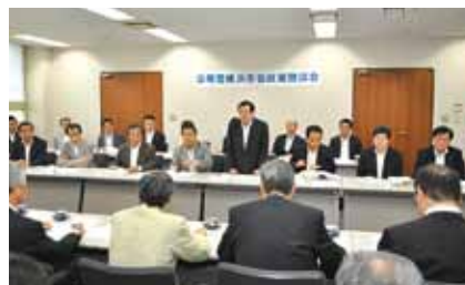
参加団体と活発な意見交換が行われた(6月25日市会会議室)

道路などの調査診断を手掛ける企業を訪問し、空洞探査技術により道路の陥没を未然に防ぐ取組などについて、関係者から説明を受けました。 震災に備え、都市インフラの危険要因を的確に把握し、防災・減災対策に生かす取り組みの必要性について意見交換しました。