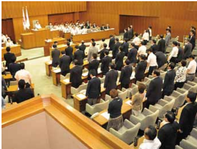
賛成多数で市民協働条例が可決された(6月21日本会議場)

公明リードの議員提案条例 公明党が主導して提案した「横浜市市民協働条例」が公明、自民、民主、みんなの党、共産、ヨコハマ会の全ての会派の賛成によ