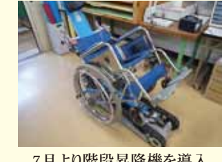
7月より階段昇降機を導入

7月24日、市教育委員会が南瀬谷小学校に工レベーターを設置するための調査結果を関係者に説明。計画案では、建築基準法などの問題で、「設置が難しい」とのことですが、引き続き他の選択肢を抽出し再調査することになりました。