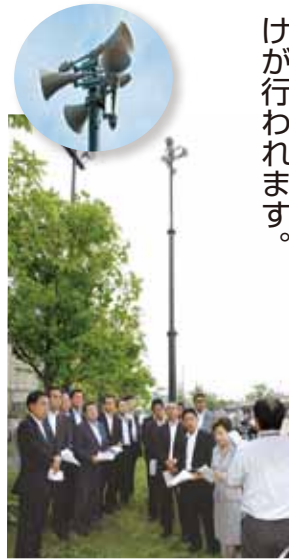
設置状況を視察 (6月8日象の鼻パーク)

津波警報伝達システム 気象庁発表の津波警報を受けて、自動的に緊急情報を一斉に放送する装置です。沿岸6区(鶴見、神奈川、西、中、磯子、金沢)で約100箇所整備されます。『耳の不自由な方や外国人にも配慮したシステムにすべき』との公明党からの提案により、ライトの点滅や「Tsunami」を強調した呼びかけが行われます。