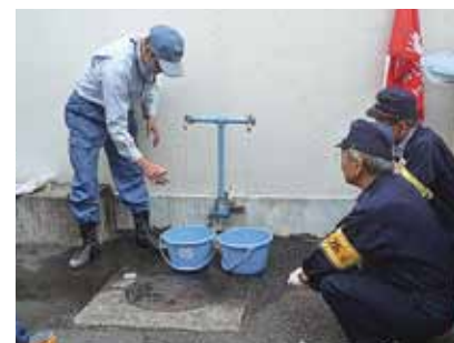
三ツ境小学校での訓練(10月20日)

横浜市では、市立小中学校の中から453カ所を地域防災拠点に指定しています。しかし、飲料水としての災害用地下給水タンクや緊急給水栓が設置されていない172カ所では、近隣施設の地下タンクや給水栓を利用するしかない不便な状況でした。 そのため172カ所の小中学校に設置されている受水槽や屋上の高置槽を活用し、さらに防災訓練に学校受水槽等からの応急給水訓練の実施を盛り込むよう提案しました。今後各区での展開が検討されます。