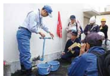
仮設給水栓からの通水を確認

10月20日、三ツ境小学校地域防災拠点において、災害時に飲料水を確保するため、「学校の受水槽を活用した応急給水訓練」が行われました。この様な訓練は、全国でも珍しく横浜市では初。 これは、私たちが以前より提案・要望していたことが実現したものです。