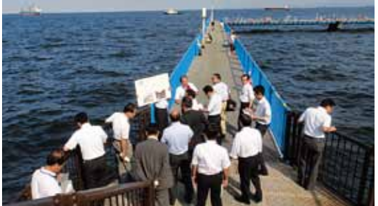
港湾施設を視察(8月9日)

都市インフラの総点検を進む! ヨコハマ・リフレッシュ計画 震災に備え、老朽化する都市インフラの危険要因を把握して、防災・減災対策に生かす取り組みが重要との観点から、公明党横浜市議員団は本年8月、市長に「事前防災・減災の推進を求める要望書」を提出しました。 横浜港の235ある岸壁や護岸といった主な港湾施設のうち、建造後50年以上経過しているものは現在48施設、20年後の2032年時点では半数近い115施設に上りま