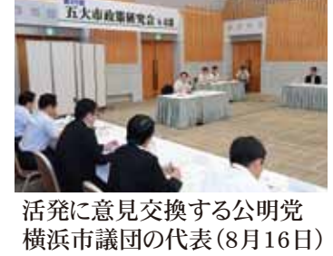
公明党の代表と横浜市議団の意見交換(8月16日)

大都市共通の政策課題を議論する公明党の「五大市政研究会」(横浜・名古屋・京都・大阪・神戸)でも、各都市の取り組み状況について報告し合いました。 市内緊急輸送路の空洞調査を市長に提案した横浜市の取り組みや、公共土木施設を長寿命化することで、今後50年の整備費をおおよそ半減できるとする名古屋市の予防保全計画の実例などが注目を集めました。また、レベニュー債など民間企業の活力を生かした財源調達についても議論しました。