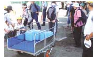
以前はリヤカーで...

その都度、訓練参加者から私に「高齢者が約1キロ先の原中学校まで水汲みにリヤカーを押すのは現実的ではない」という声も聞かれました。