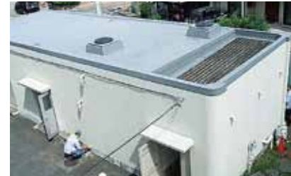
活用される受水槽(三ツ境小)