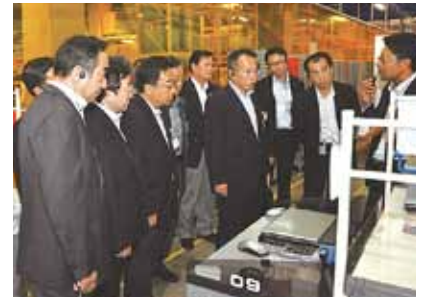
医薬品用物流拠点を視察(8月27日)

■災害時も安心の医薬品供給を 横浜市は10月3日、医薬品卸5社と災害時の医薬品供給に関する協定を締結しました。薬は水や食料とともに災害時の必需品であり、市民に必要な医薬品を確実に届ける体制整備が急がれていました。 公明党横浜市議員団は、「震災時の医薬品の供給は重要なことであり、官民一体で市民の命を守る体制づくりに全力で取り組むべき」との考えから、医療用医薬品等の物流拠点を訪問し、協定締結を推進してきました。